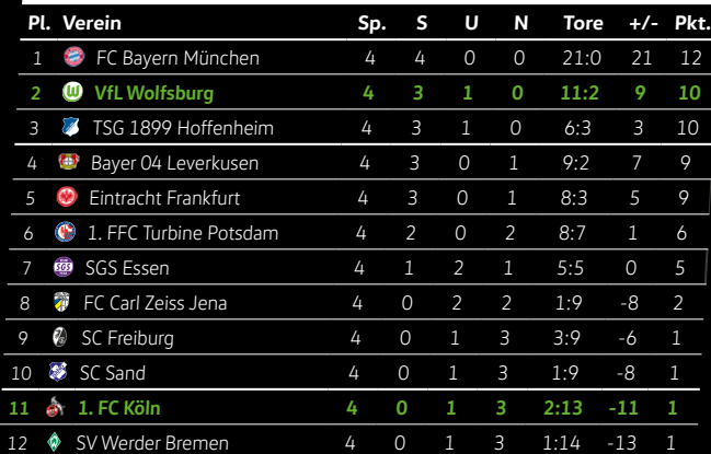
TABELLE DER FLYERALARM FRAUEN-BUNDESLIGA

Meister, Zweit- und Drittplatzierter sind für die UEFA Women's Champions League qualifiziert. Die letzten beiden Mannschaften steigen in die 2. Frauen-Bundesliga ab. Stand: 8. Oktober 2021